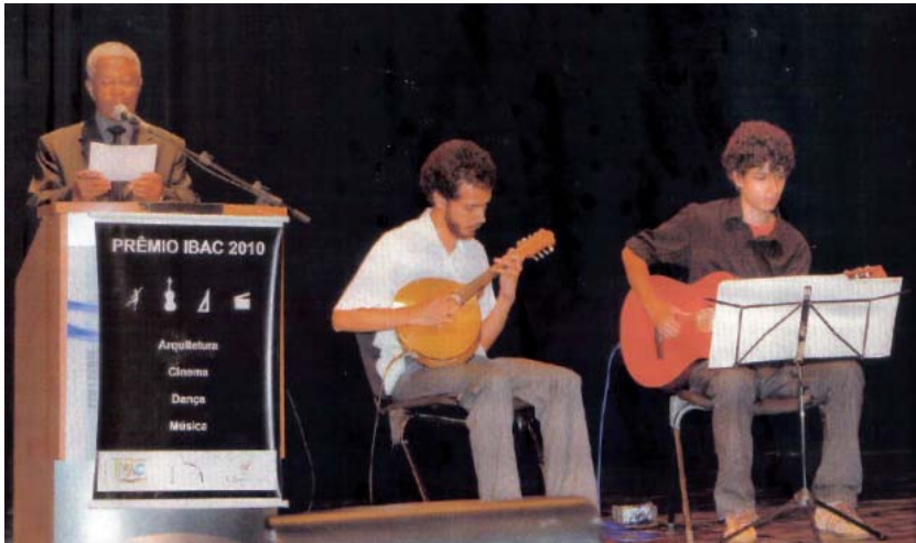
Evento teve cobertura dos mais diferentes veículos, entre eles a revista Caras

O Grupo de Choro do Conservatório de Tatuí foi a atração musical especialmente convidada para a final do Prêmio IBAC 2010 – Instituto Brasileiro Arte e Cultura, realizado em parceria com a Escola da Cidade e Aliança Francesa. O evento ocorreu em 24 de novembro.