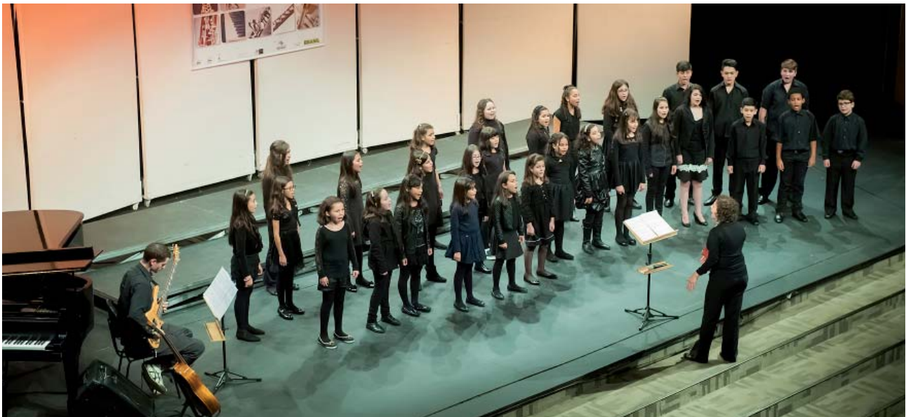
Coro Infantil do Conservatório de Tatuí

A apresentação integra a III Semana de Prática de Conjunto. O evento é realizado ao final de cada bimestre letivo como forma de apresentar publicamente o resultado dos estudos dos alunos dos cursos de música clássica. Os concertos, variados, são gratuitos e ocorrem em diferentes locais. A coordenação é de Max Ferreira. Neste bimestre, as apresentações serão realizadas de 10 a 19 de outubro.