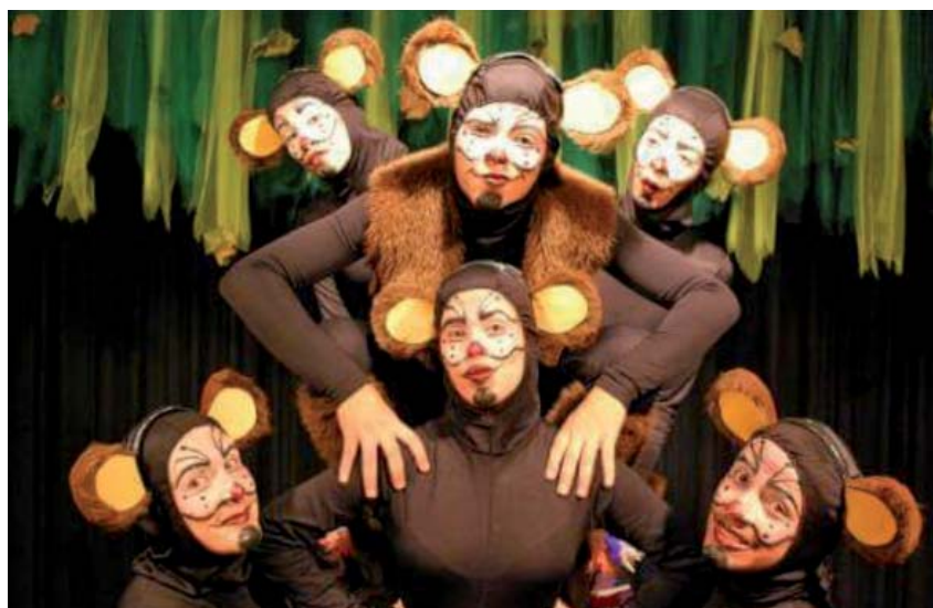
Quem Casa Quer Casa