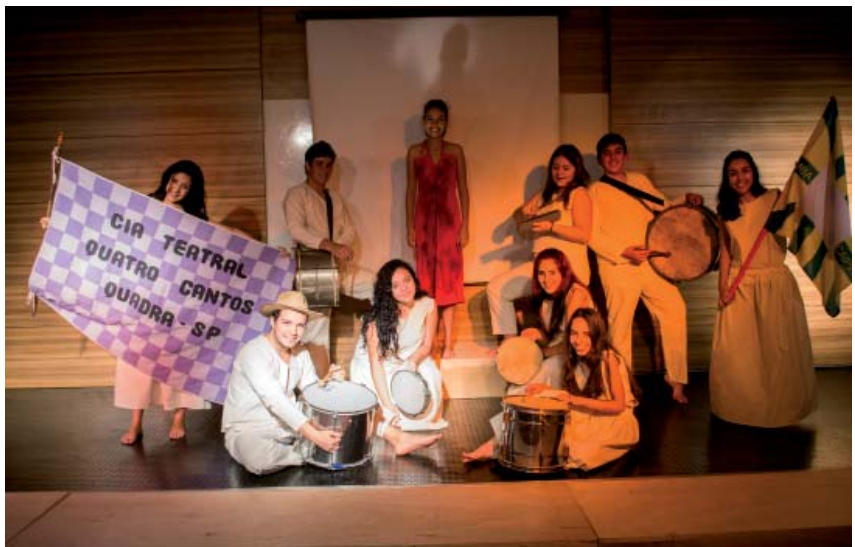
Santa Joana do Samba