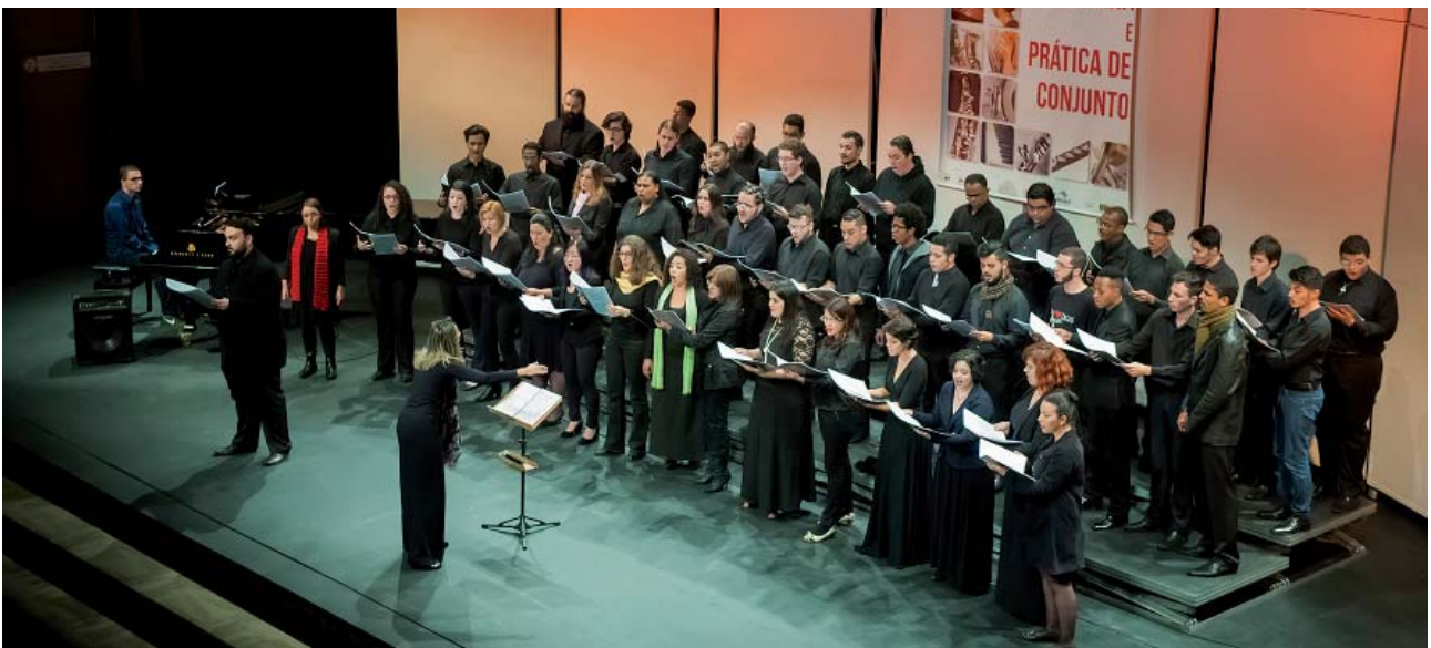
Coro de Câmara e Coro Sinfônico Jovem do Conservatório de Tatuí