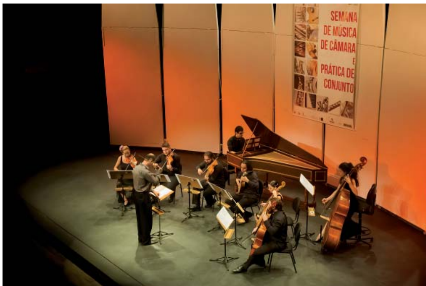
Ensemble de Performance Histórica

realizado ao final de cada bimestre letivo como forma de apresentar publicamente o resultado dos estudos dos alunos dos cursos de música clássica. Os concertos, variados, são gratuitos e ocorrem em diferentes locais. A coordenação é de Max Ferreira. Neste bimestre, as apresentações serão realizadas de 10 a 19 de outubro. A programação completa pode ser acessada no site conservatoriodetatui.org.br