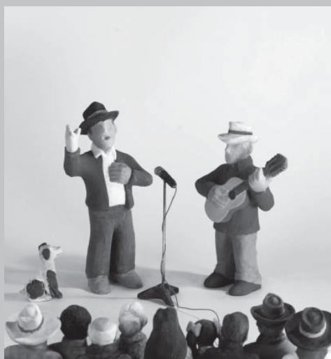
Ilustração de 2012

O material gráfico é assinado por Jaime Pinheiro e Paulo Rogério Ribeiro.