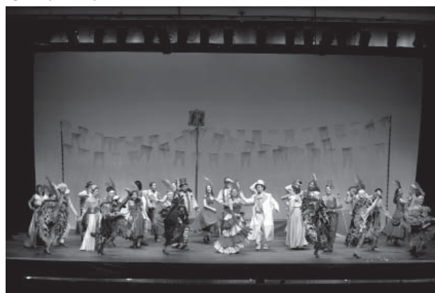
Ópera Orfeu no Inferno

tarefas que demandam concentração e sensibilidade por parte daqueles que lideram o elenco”, diz a professora. “Poderíamos listar mais uma porção de desafios próprios ao processo de criação e realização de um espetáculo operístico, envolvendo também os outros profissionais de cenário, figurino e iluminação entre outros. A produção de uma ópera é um exercício de união de forças, de contribuição de cada parte envolvida funcionando em constante sinergia. O espetáculo de ópera exige uma equipe alinhada e eficiente em direção a um único objetivo.”