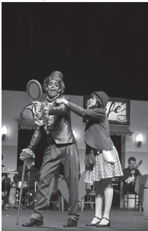
Cena de “Um Chorinho para Dona Baratinha”

palestra sobre “Projeto Conexões: Dramaturgia para Jovens”. Às 20h30, é a vez do espetáculo “Quadrado”, da Cia. Núcleo 2 de São José do Rio Preto, com criação, concepção e direção de Jef Telles.