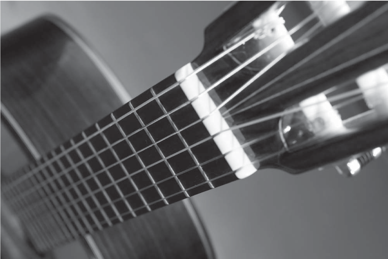
Edição deste ano premia luthiers de violão