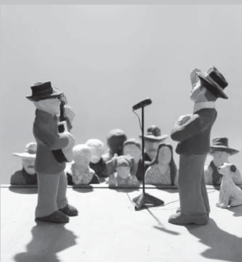
Ilustração de 2013