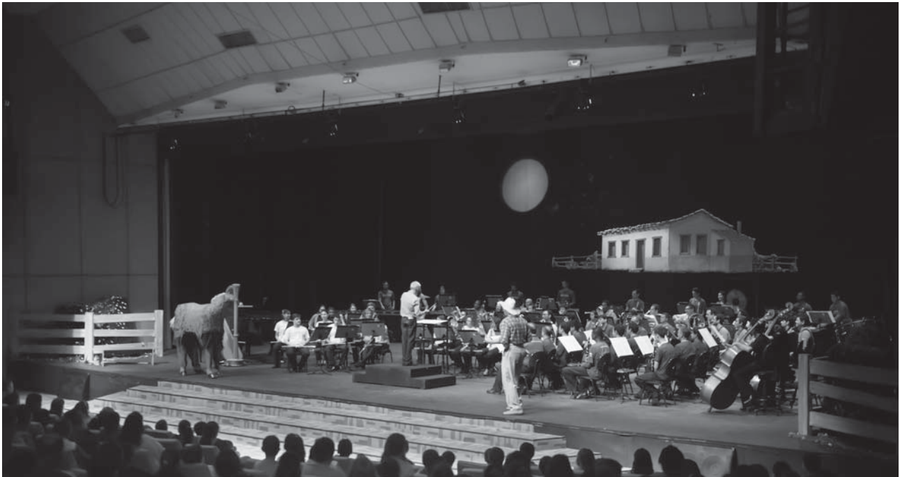
Espectáculo didático encantou plateia