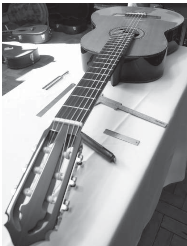
Melhores violões serão premiados

O regulamento completo do concurso pode ser acessado no site www.conservatoriodetatui.org.br