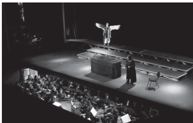
Ópera Orfeu e Euridice