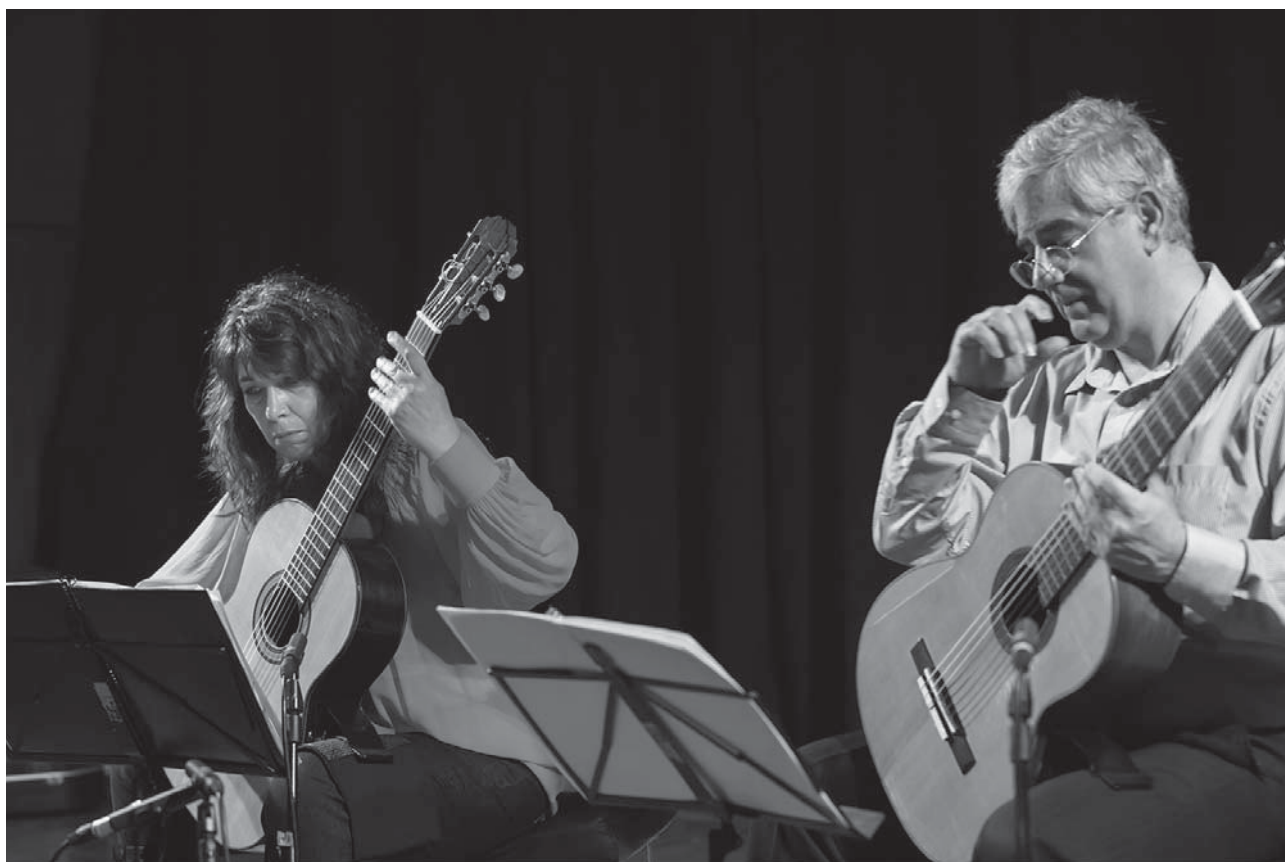
Violão Artes Duo