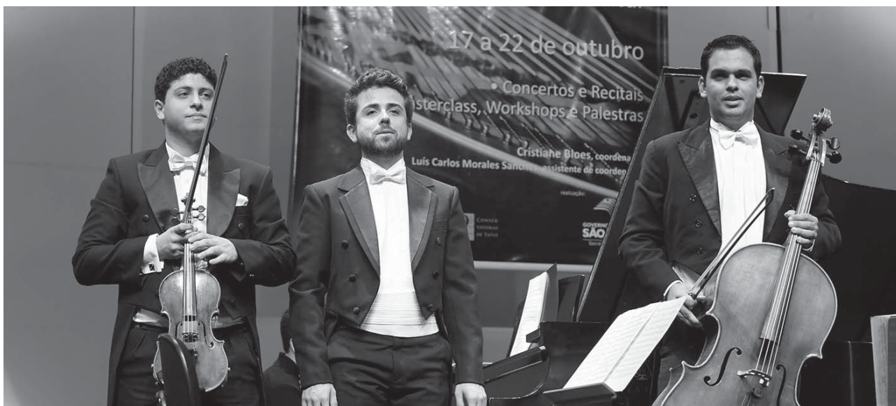
Trio Atlântica é um dos convidados do evento

estados do Espírito Santo, Minas Gerais, Rio de Janeiro e São Paulo. As provas serão realizadas de 14 a 19 de outubro, em diferentes locais nas dependências do Conservatório de Tatuí. Em todas as datas, às 20h30, serão realizados concertos com convidados especiais. Neste ano, os concursos fazem homenagens ao compositor Camargo Guarnieri. A edição nacional oferece R$ 8,5 mil em prêmios aos primeiros colocados. Todos os candidatos deverão executar uma obra de confronto de Camargo Guarnieri (o Ponteio n. 47 na edição nacional e outras obras que variam conforme a categoria dos inscritos na edição interna) e uma obra de livre escolha de compositor brasileiro (ou naturalizado brasileiro). O vencedor da disputa nacional receberá prêmio de R$ 5 mil. O segundo e terceiro colocados receberão, respectivamente, R$ 2.500 e R$ 1.000. Também serão conferidos dois prêmios especiais: o de melhor intérprete de Camargo Guarnieri e o prêmio “Zoraide Mazzulli Nunes”, em homenagem á mais antiga professora de piano do Conservatório de Tatuí. Todos os candidatos que se apresentarem receberão certificados de participação.