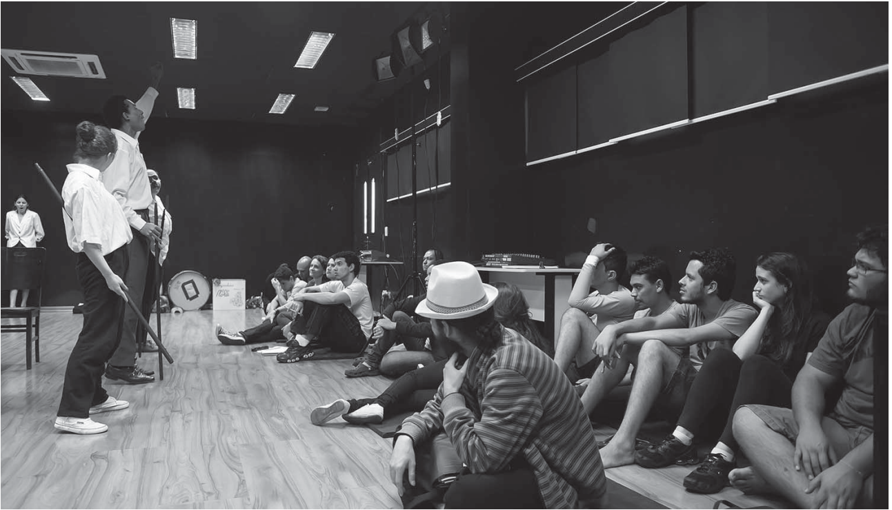
Oficinas foram realizadas nas dependências do Conservatório de Tatuí