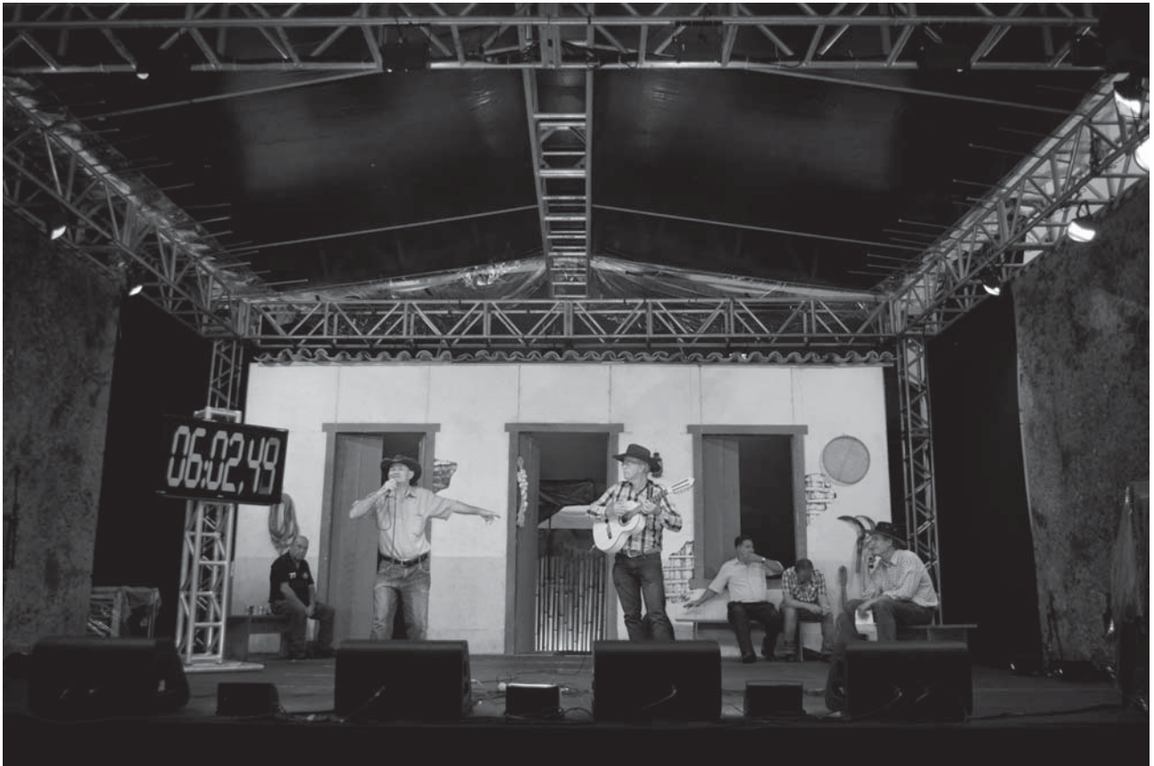
Torneio Estadual de Cururu