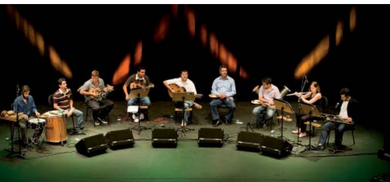
Grupo de Choro do Conservatório de Tatuí