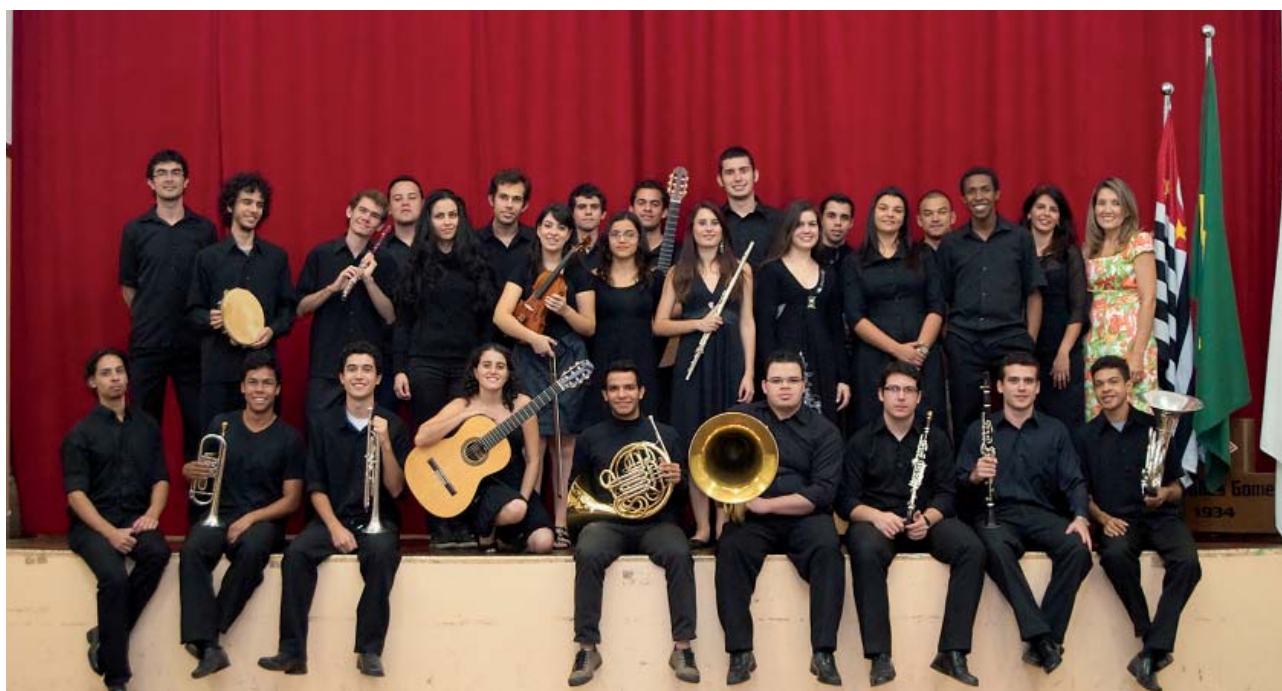
Alunos da primeira turma do curso técnico de música e luteria: jovens serão certificados no início de 2013