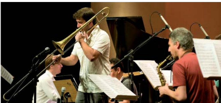
Jazz Combo do Conservatório de Tatuí