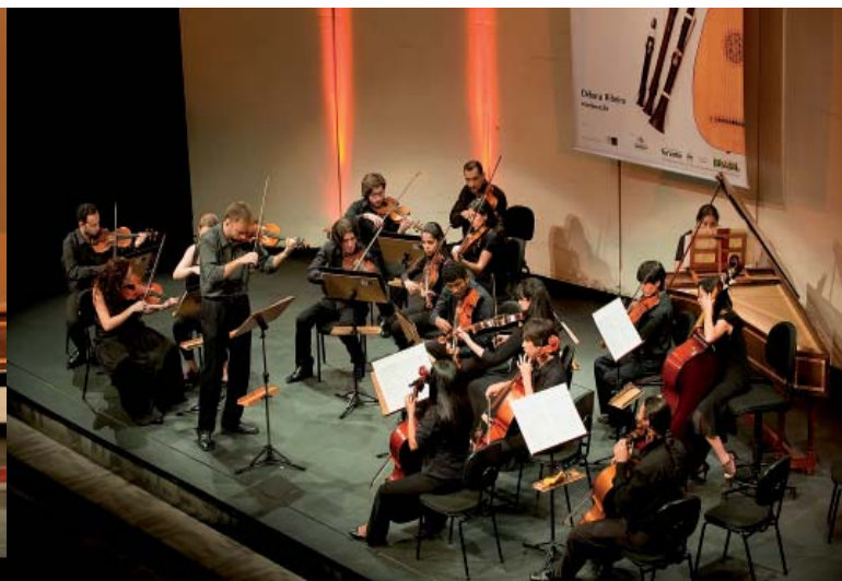
Concerto de encerramento da Orquestra de Alunos e Professores do Encontro