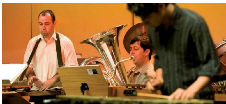
Grupo de Percussão do Conservatório de Tatuí