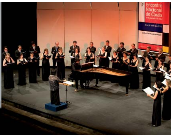
Coro da Osesp