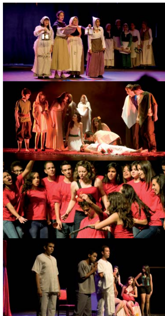
De cima para baixo: Alegorias Pantagruélicas, Orfeu e Euridice, Arena conta Danton e Agora era Tarde.

Já a Mostra Paralela, levou as mais diferentes e divertidas produções à Praça da Matriz e Sala Preta, do setor de artes cênicas. Um grande público acompanhou os espetáculos. Participaram da Mostra Paralela, os grupos Estudio Barbara Lopes, Gira de Siá, Coral da Cidade José dos Santos; e os espetáculos “Bantupi Soundz”, “Iepe”, “Contos de Cascudo”, “O Esperto Imaginário”, “Cabaré Lástima”, “O Brasil no meu Quintal”, “Perdoa-me por me Traíres”, “Contação de História”, “Devo Engolir Sr. Heart?”, “Natureza Matéria Forma”, “A Incrível Viagem de Jacó Vemcá em Busca da Verdade”, “Tramas e Tramóias”, “Mustache”, “Coração de Menino em Noite de São João”, “Metamorfético” e “Faz de Conta que tem sol lá fora”.