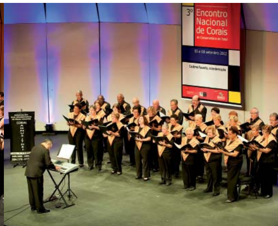
Coro participante do Encontro