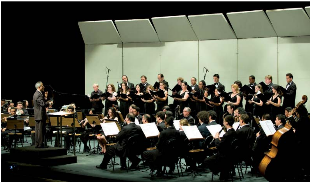
Banda Sinfônica e Coro Sinfônico do Conservatório de Tatuí na Solenidade de Entrega dos Hinos da Comarca de Tatuí, em outubro do ano passado

Evento acontece no dia 19, com a presença de prefeitos eleitos; todos os hinos deverão ser executados