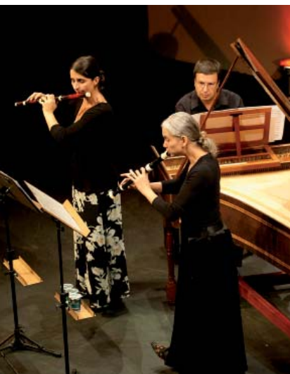
Recital de Professores e convidados do Encontro