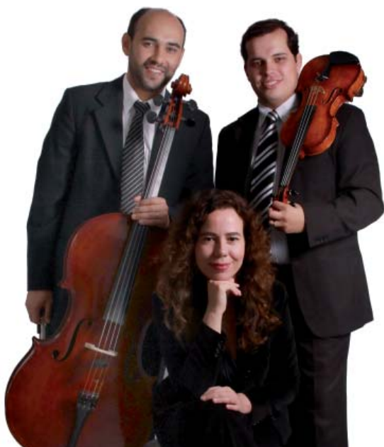
Musicum Trio: competição de música de câmara na Alemanha