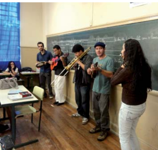
Grupo de alunos leva apresentação de choro às salas de aula do “Barão de Suruí”, em Tatuí