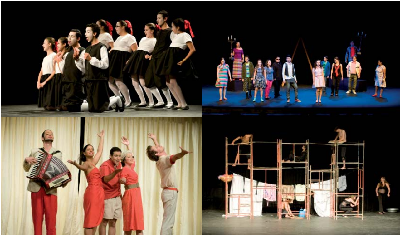
No sentido horário: O sonho de Nágila (espetáculo vencedor), Como fazer Teatro em Cinco Lições (espetáculo convidado), Agreste e Coração materno.