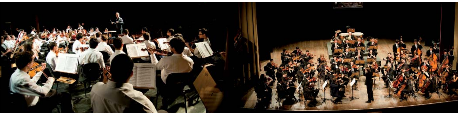
Sesc Interlagos - São Paulo