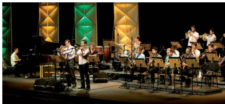
Big Band do Conservatório de Tatuí