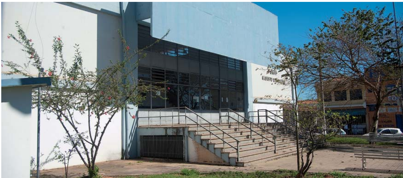
Prédio abrigou o fórum de Tatuí por muitos anos e, agora, dará lugar à música

Imóvel que abrigava antigo fórum foi cedido para utilização da instituição; adequações envolvem isolamento acústico