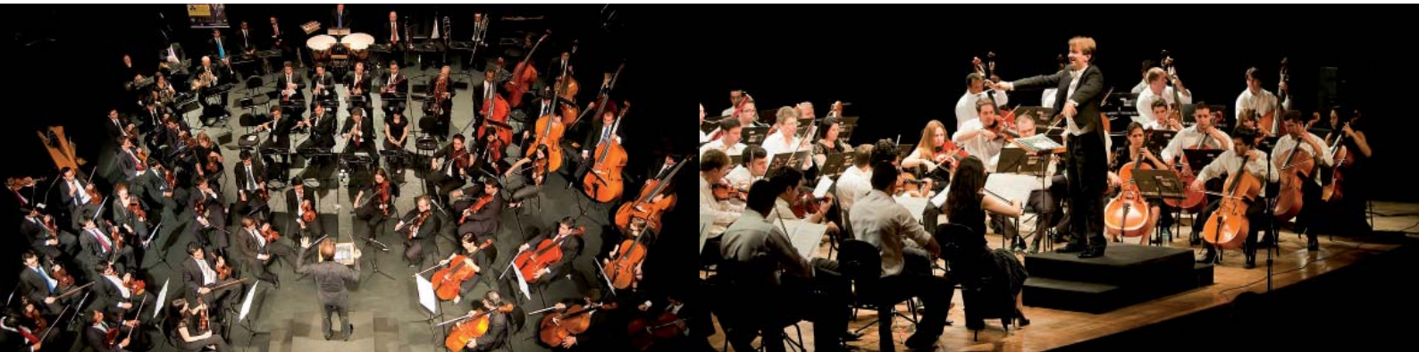
CEU Aricanduva - São Paulo