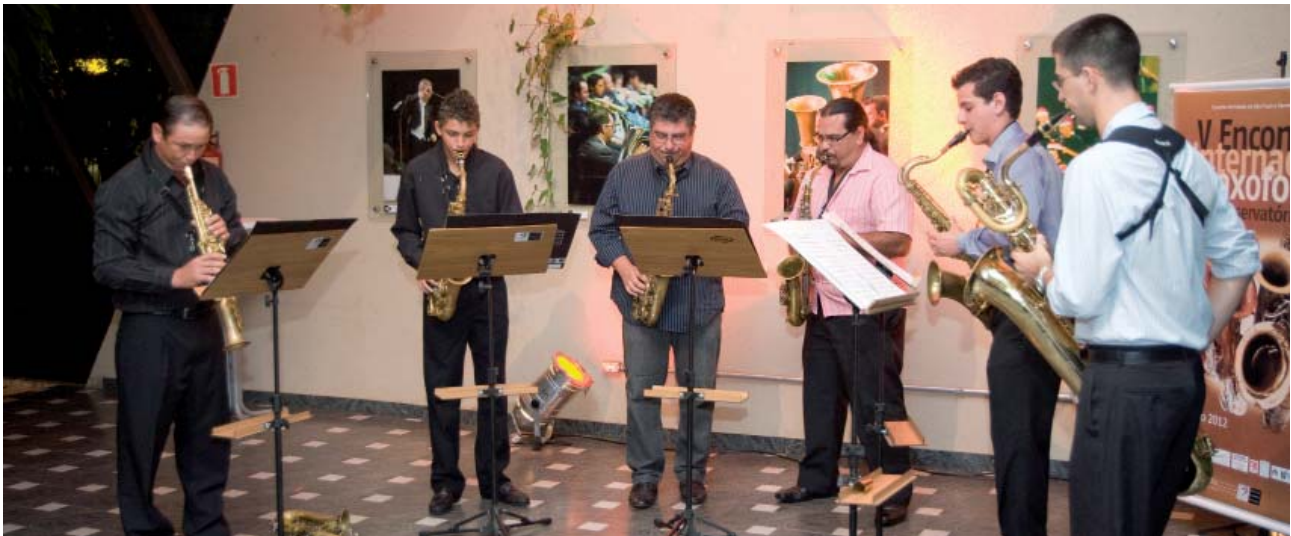
Grupo de Saxofones do Conservatório de Tatuí em São José do Rio Pardo