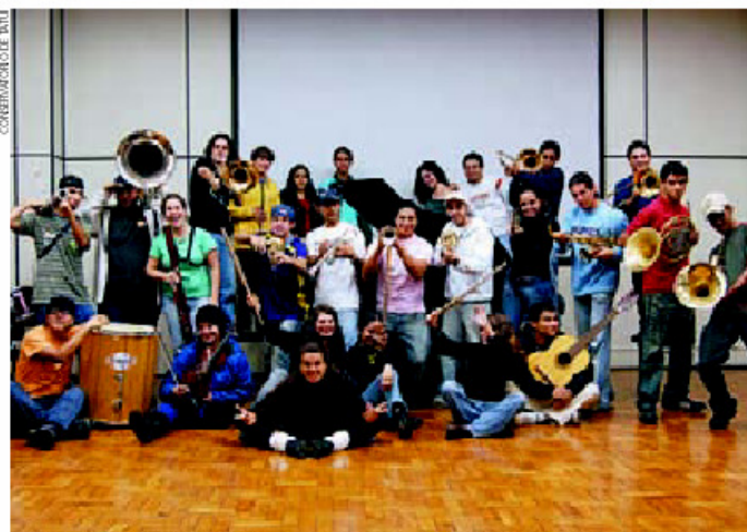
Grupo de performance Avati Pororó se apresenta no dia 26 com o espetáculo Quadrilhas

O grupo é formado por cinco trompetes, duas trompas, três trombones, uma tuba, três saxofones, três percussionistas, dois