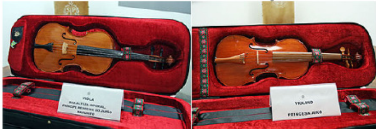
Em estojos, viola e violino que o príncipe herdeiro do Japão, Naruhito, e a filha dele, Aiko, irão ganhar do governo

Fundado em 1954, o Conservatório de Tatuí é um centro de formação de instrumentistas e de luthiers --nome dos profissionais especializados em construir e consertar instrumentos de corda com caixa de ressonância. O curso dura quatro anos, é gratuito e, a cada ano, entram apenas quatro alunos. No ano passado, houve 58 candidatos às vagas.