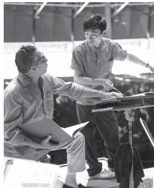
Ensinando Seiji Ozawa, em Tanglewood.