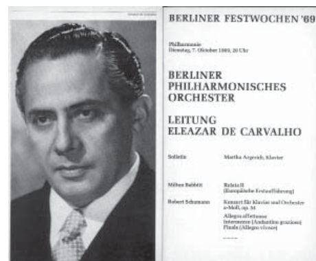
Programa da Filarmônica de Berlim