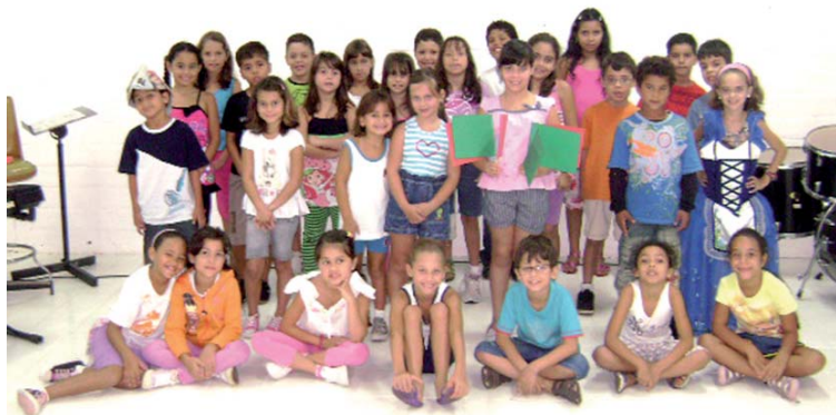
Os alunos formando o coro de ópera, junto com os solistas da mini-ópera "Marcha Soldado"